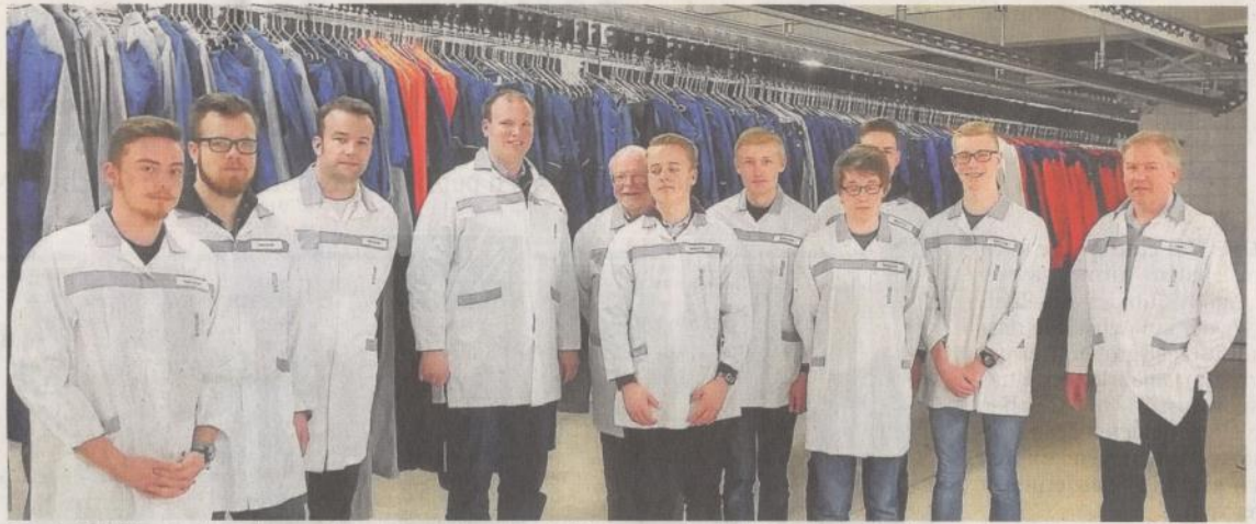
Ob die Schüler das Waschen zu Hause nun auch neu organisieren werden, bleibt noch abzuwarten.